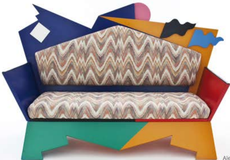
Alessandro Mendini, Kandissi 1978