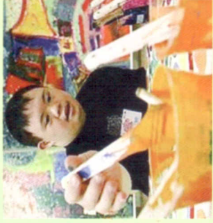
Laboratori Creativi Artistici