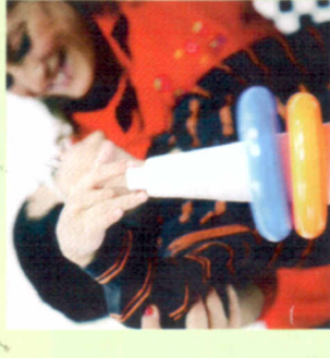
Recupero Scolastico Doposcuola