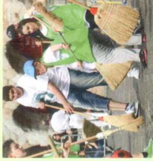
Attività Psicopedagogiche Gioca Sport