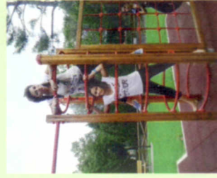
ed ancora... Servizi Baby Parking Gite ed Escursioni Feste